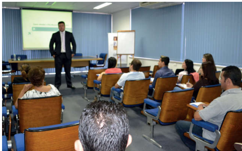
Palestras contaram com bom público

Cursos ministrados pelos consultores da CNI, em 2014 foram: Como pagar menos tributos; Como atender a fiscalização do Trabalho e Como evitar problemas trabalhistas. Os cursos com carga horária de 08 (oito horas). Através das avaliações constatamos a grande aceitação por parte dos associados, que já aguardam novos temas para 2015.