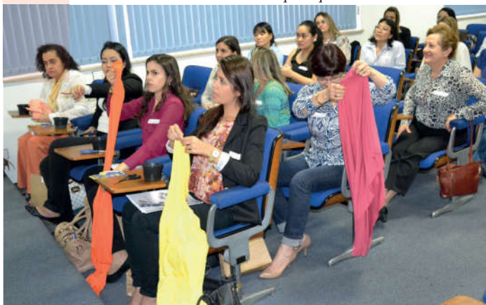
Artesanato oferecido pelas professoras SESI- Catumbi

Ao final das atividades foram sorteados brindes oferecidos pelos patrocinadores do evento: Companhia de Soluções; FMU, FBN; Consult Aposentadoria; Aquário de São Paulo; dentre outros.